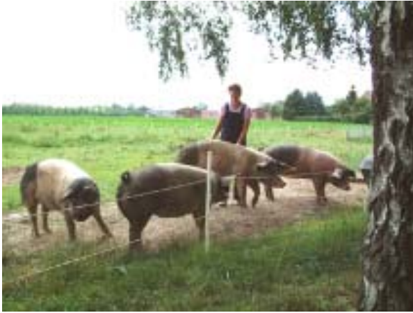
Immer schön von der Seite und dann den Rücken schubbern

Gelernt hatte ich schon, dass die Vier mit vollem Magen viel umgänglicher und rücksichtsvoller sind. Also habe ich sie möglichst erst einmal gefüttert, in der Regel, wenn sie gerade durch etwas anderes abgelenkt waren. Während sie sich dann anschließend über ihre Futterschalen hermachten, habe ich sie immer wieder gestreichelt und mit ihnen gesprochen. - Witzig ist übrigens, dass die Großen, genauso wie meine Kleinen, dauernd von einer Futterschale zu einer anderen wechseln.