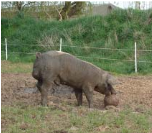
Herr Peters trainiert für die Europameisterschaft