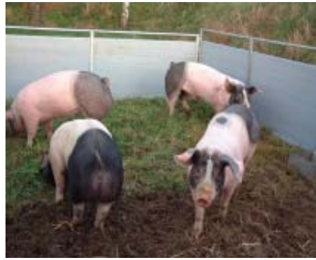
Grab, wühl, schnupper - hmmm

Nachdem alles aufgebaut und das Wasser angeschlossen ist, lädt Willi meine neuen Schweinchen auf den Lkw und bringt sie ins Feld. Sofort wird alles so richtig unter den Rüssel genommen. Es riecht doch so neu und ungewohnt. Frisches Gras und Erde zum Wühlen. Nur in der Box gibt es natürlich ausreichend Stroh. Es ist ja noch nicht so wirklich warm und nachts noch immer um die null Grad. Da brauchten die Kleinen schon ordentlich Material zum Einkuscheln. Wir haben die Vier dann in Ruhe ihr neues Zuhause erkunden lassen.