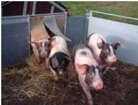
Von rechts: Herr Peters, Pünktchen, Erika und Traudi kommt gerade aus der Box

Bevor es dunkel wird, gibt es eine ordentliche Portion Futter und was noch? Klar doch: Leckerchen. Später am Abend gehe ich noch mal nach dem Rechten schauen. Ich schleiche mich an die Box heran und da liegen sie. Gemütlich aneinander gekuschelt im Stroh. Es ist sogar manchmal ein leises Schnarchen zu hören. Übrigens: Schweine schlafen nur wirklich fest und entspannt, wenn sie auf der Seite liegen. Wusstet ihr das schon?