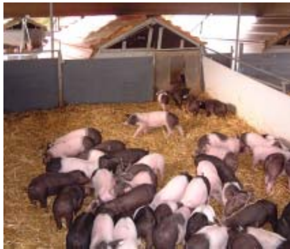
Das neue Zuhause mit Isy-Box

Am späten Nachmittag komme ich dann endlich dazu, die Schweinchen noch einmal zu besuchen. Die Kleinen scheinen sich schon so richtig in ihrem neuen Gehege heimisch zu fühlen. Alles wuselt permanent herum. Hütte rein, Hütte raus. Mal am Fressnapf vorbei und noch schnell ein Schluck getrunken. Allerdings erfolgt das alles unter permanentem Gebrumme. Bei allem Spielen suchen sie immer noch mal nach ihrer Mutter. Die doch sonst immer da war, wenn man sich bemerkbar gemacht hat. Dieses Brummen wird wohl auch noch zwei Tage andauern. Erst dann ist die Trennung von der Mami endlich überwunden. Ich fahre derweil nach Bochum und werde mich wohl vier Tage gedulden müssen, bis ich die Rasselbande wiedersehe.