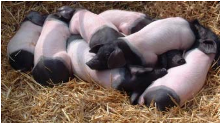
Gerade mal vier Wochen alt und schon auf großer Tour