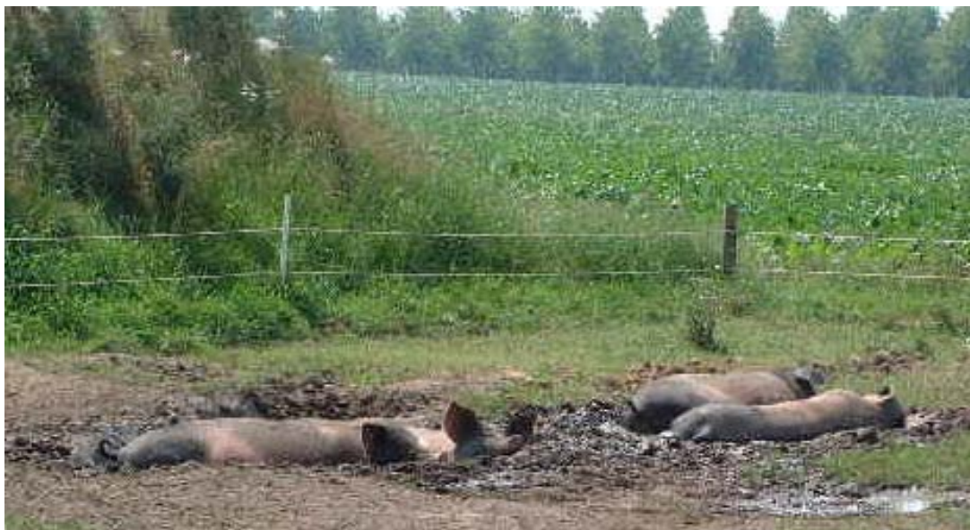
Bei 34° im Schatten bleibt nur noch die Suhle. Nach 7 Tagen Sommer hatten sich bereits kleine Schwimmhäute zwischen den Klauen gebildet :-))

So sind die drei Weiber ganz liebe, zutrauliche und verschmuste Mädels, so richtig zum Knutschen. Und auch Herr Peters hat sich noch nie danebenbenommen. Er ist, wie jeder Halbwüchsige, vielleicht manchmal etwas forsch und kann seine Kräfte uns Menschlein gegenüber nicht so wirklich abschätzen. Aber er schaut immer wie ein verschmitzter Lauser und kann herzerweichend Bitte sagen. Ich beachte dabei wahrscheinlich seine Regeln und er respektiert die meinen, so kommen wir hervorragend miteinander klar.