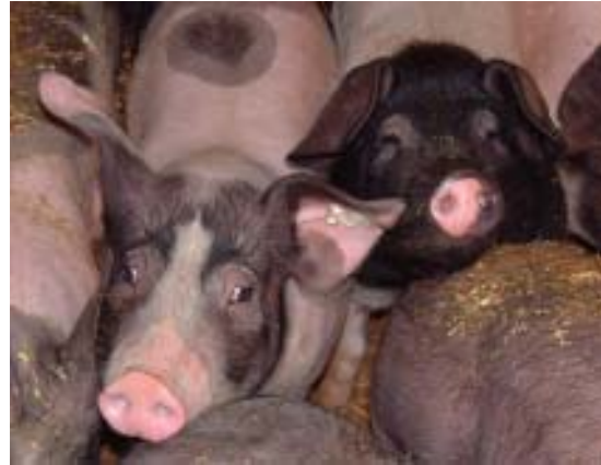
Püñkchen mit dem Mohrenköpfchen, Erika

Meine „Jungs“ hatten nach Weihnachten eine neue ISY-BOX für meine Outdoor-Schweine gebaut, voll isoliert, mit Lüftungsklappen vorn und hinten sowie integriertem Futterkasten. Heute soll der Umzug stattfinden. Zuerst wird die Box ins Feld gefahren und richtig platziert. Dann bauen wir zur Umgewöhnung erst einmal einen stabilen Zaun von 6 x 3 m an das neue Schweine-Zuhause.