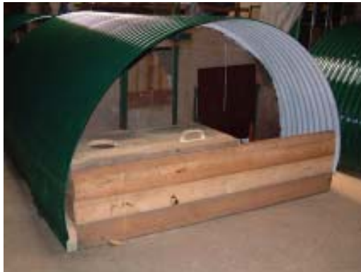
Bei der Luxusausstattung wurde die Ferkelveranda komplett überdacht

Zum Schluss werden die Boxen in Moosgrün lackiert, für die Rotlichtlampe wird noch ein Loch in die Decke des Ferkelnests gesägt. Jetzt fehlen nur noch die Transporthaken und die neuen Abferkelboxen sind perfekt.