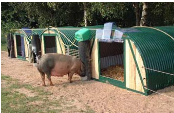
Mit Futter kriegen wir sie alle - immer wieder!

Sie kommt gerade des Weges getrottet, fragt mich, ob's wohl noch ein Leckerchen gibt , und schwupps ist der Zaun zu. Ich locke sie zu ihrem neuen Futtertrog, somit ist sie vorläufig beschäftigt. Da ihre Kumpels ziemlich verwundert sind, bekommen auch sie ihr Futter, das hilft immer.