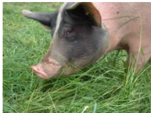
Traudi mit einem prüfenden Blick von der Seite