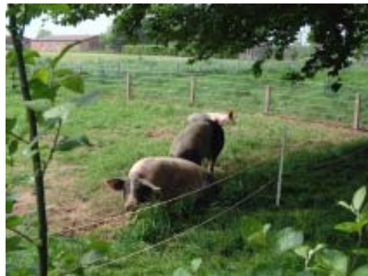
In der Mittagspause sucht man sich ein schattiges Plätzchen und macht es sich gemütlich