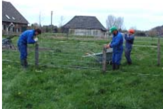
...und gemessen und geschraubt.