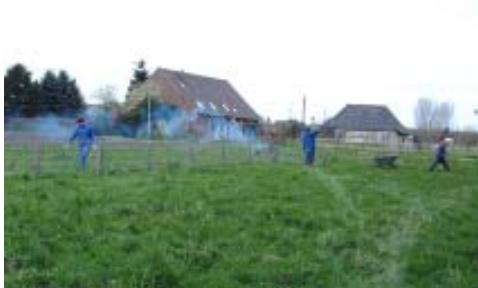
Hier wird kräftig geschleppt und gebaut...

Nach einem reichhaltigen, ausgiebigen Frühstück werden am Ostersonntag die Blau-männer, Gummistiefel und Arbeitshandschuhe verteilt. Kurze Lagebesprechung und schon geht's los. Die Mädels bauen das alte Minischwein-Gehege ab und die Jungs setzen schon mal die Pflöcke für das neue. Die Zaummatten werden hin und her geschleppt und schnell wächst die neue Minischweine-wiese. Zwischendurch wird immer mal wieder beraten und ein bisschen geschmust. Schon mal ein Fläschchen Bier geleert (für's richtige Maßnehmen) und trotzdem geht es zügig voran.