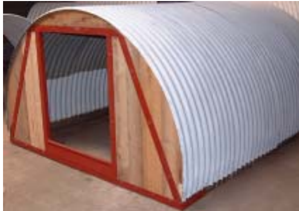
Der Rahmen ist verschweißt und mit Rostschutzfarbe vorgestrichen

Zuerst wird ein Rahmen für den Eingang geschweißt, der dann komplett mit Holzplanken umbaut wird. Der Eingang hat eine ca. 12 cm hohe Kante, damit die neugeborenen Ferkelchen erst die Hütte verlassen können, wenn sie bereits sicher auf den Beinen sind.