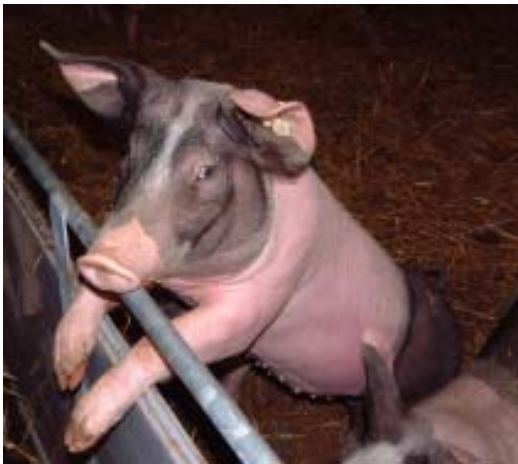
Hey, nimm mich, ich bin die beste Sau von allen!

Mit Traudi ist das schon etwas schwieriger. Willi hat gesagt, dass ich darauf achten sollte, dass die Sauen nicht zu schwächig, aber lang genug sind. Also suche ich eine richtige Willi-Sau. Und dann hat sie mich angesprochen. Sie hat sich auf die Brüstung gestellt, mich angeschaut und gesagt: „Hey, nimm mich, ich bin lang, hab 14 Zippelchen und möchte sooo gern Mami werden“. Wer kann da schon widerstehen? Na ja, jetzt habe ich meine vier Großen und kann anfangen, tolle Pläne für das neue Gehege