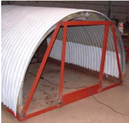
Die Hütte ist zweiwandig mit einer Isolierschicht aus Glasfaser