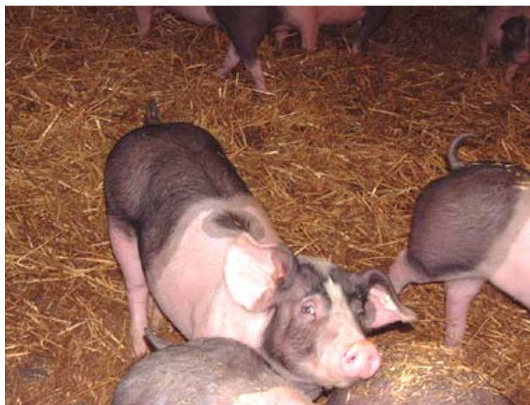
Pünktchen im Stroh an Weihnachten

Ich wusste zwar noch nicht, wer Erika und Traudi sind, aber das spielte in diesem Moment überhaupt keine Rolle. Ich hatte gerade vier richtige Schweine zu Weihnachten geschenkt bekommen und war der glücklichste Mensch der Welt.