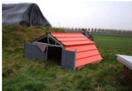
Die ISY-BOX wurde mit dem Schlepper in die Wiese gefahren und nun richtig platziert

Ich erkundige mich in der Zwischenzeit nach den unterschiedlichsten Möglichkeiten für bezahlbare, schweinesichere Zäune und allem, was man so bei der Outdoor-Haltung berücksichtigen muss. Das Gelände wird ausgemessen, ich rechne aus, wieviel Meter Zaun ich benötige, die Wasserversorgung wird sichergestellt und am 7. Februar ist es dann endlich so weit.