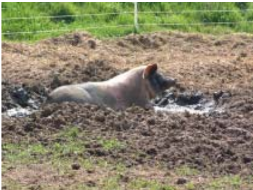
Püktchen in der heiß geliebten Suhle

Wenn jemand bisher nicht wusste, warum es eigentlich „sauwohl“ heißt, kann er es hier erfahren. Ende März findet offensichtlich der Sommer 2004 statt. Ein paar Tage lang scheint die Sonne und meine Rasselbande - ob groß oder klein - genießt das Schweineleben. Mittlerweile kann ich auch unbeschadet zu meinen Großen ins Gehege gehen und mit ihnen schmusen oder spielen, wenn sie nicht gerade ein Schlammbad genommen haben :-)). Erika wirft sich sogar schon auf die Seite, wenn ich mit der Bürste komme. Auch die kleinen Jungs haben sich wieder beruhigt. Ich habe ihnen einfach erklärt, dass sie immer noch meine Besten sind und König Dickbauch hat eingesehen, dass ihm ohne Streicheleinheiten doch jede Menge fehlt.