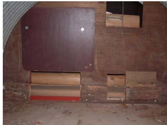
Rechts geht's ins Ferkelnest und links auf die Ferkelveranda, beides gesondert zu schließen

Dann wird eine Rückwand eingezogen. Im oberen Bereich wird für die Durchlüftung ein Fenster ausgesägt und am Boden zwei flache Durchgänge für die Ferkelchen. Der eine Durchgang führt ins Ferkelnest, das später mit einer Rotlichtlampe schön kuschelig warmgehalten wird. Das andere Loch führt auf eine „Ferkelveranda“, auf die nur die kleinen Schweinchen rauskönnen, um ihre ersten Geschäftchen zu verrichten. Beides natürlich überdacht, damit's nicht reinregnet.