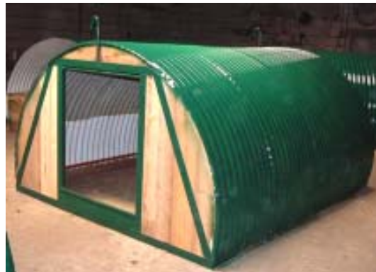
Lackiert in einem freundlichen Moosgrün passen die Boxen optimal in die Landschaft