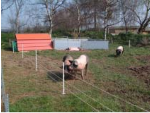
Das ist toll: ein richtige Wiese, ganz für uns alleine!